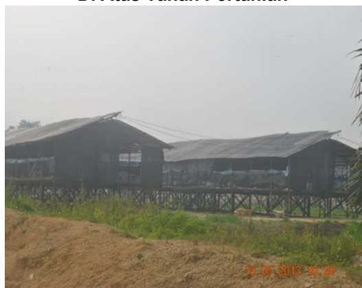
Gambar 1.14 Perusahaan Ternakan Ayam Di Atas Tanah Pertanian

Lokasi: Taboh Naning, Daerah Alor Gajah Tarikh: 15 Mei 2013