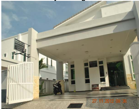
Gambar 1.1 Pejabat Peguam

Lokasi: Bandar Bukit Baru Sek III, Daerah Melaka Tengah Tarikh: 27 November 2012