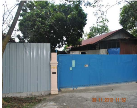
Gambar 1.2 Kilang Papan

Lokasi: Bukit Katil, Daerah Melaka Tengah Tarikh: 30 November 2012