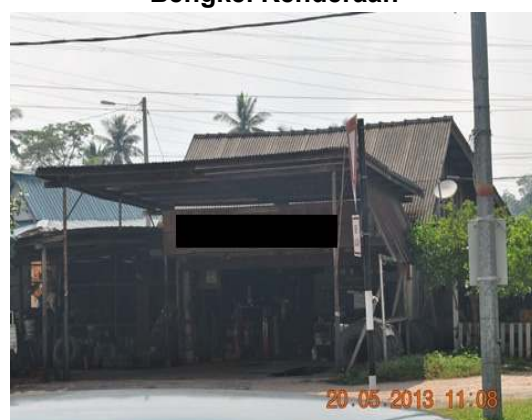
Gambar 1.6 Bengkel Kenderaan

Lokasi: Kelemak, Daerah Alor Gajah Tarikh: 20 Mei 2013