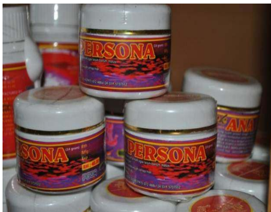
Gambar 2.11 Produk Tiada Tarikh Pengilangan Dan Tarikh Luput

Lokasi: SDSI Negeri Pulau Pinang, MITC Melaka Tarikh: 27 Ogos 2012