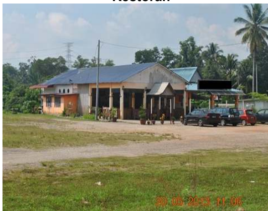
Gambar 1.5 Restoran

Lokasi: Kelemak, Daerah Alor Gajah Tarikh: 20 Mei 2013