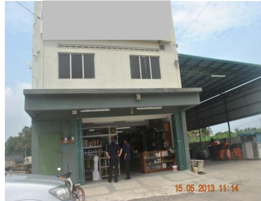
Gambar 1.12 Bangunan Perniagaan Di Atas Tanah Pertanian

Lokasi: Taboh Naning, Daerah Alor Gajah Tarikh: 15 Mei 2013