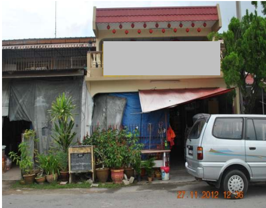
Gambar 1.11 Bangunan Perniagaan Di Atas Tanah Kediaman

Lokasi: Taman Asean, Daerah Melaka Tengah Tarikh: 27 November 2012