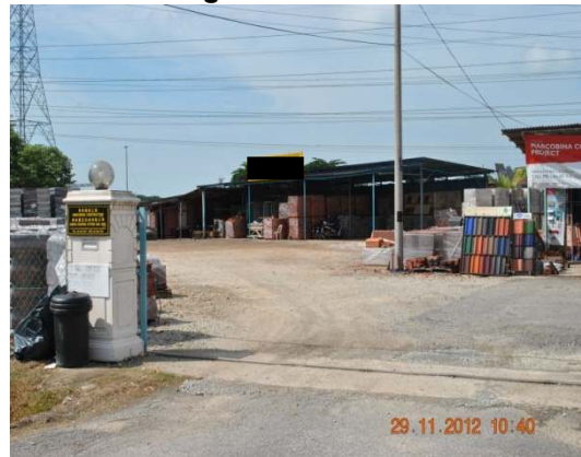
Gambar 1.4 Perniagaan Bahan Binaan

Lokasi: Semabok, Daerah Melaka Tengah Tarikh: 29 November 2012