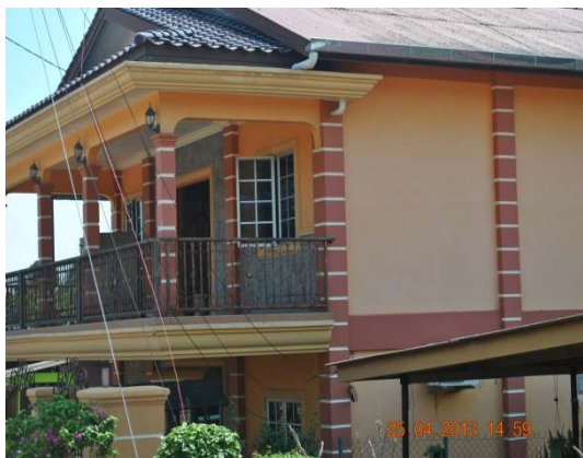
Gambar 1.7 Perusahaan Kuih Bahulu

Lokasi: Sungai Baru Ilir, Daerah Alor Gajah Tarikh: 25 April 2013