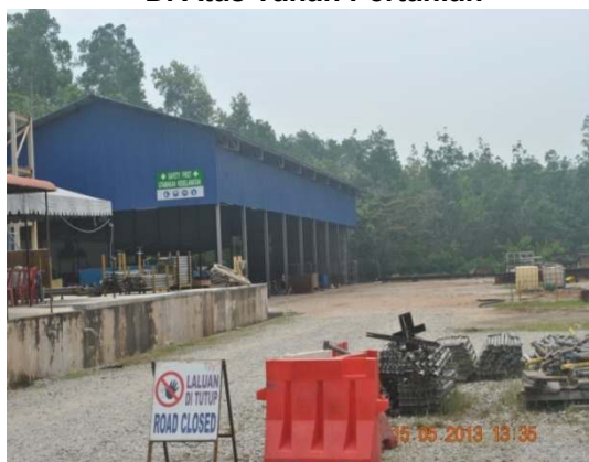
Gambar 1.13 Bengkel Perniagaan Di Atas Tanah Pertanian

Lokasi: Taboh Naning, Daerah Alor Gajah Tarikh: 15 Mei 2013