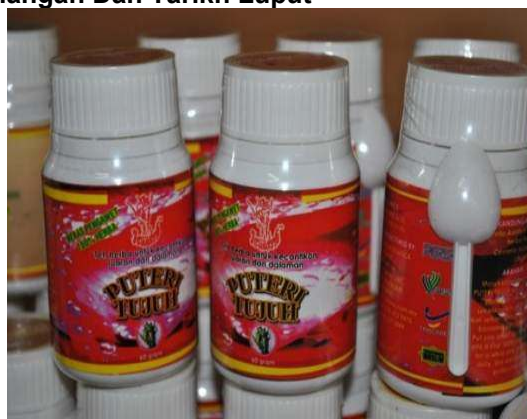
Gambar 2.10 Produk Tiada Tarikh Pengilangan Dan Tarikh Luput

Lokasi: SDSI Negeri Pulau Pinang, MITC Melaka Tarikh: 27 Ogos 2012