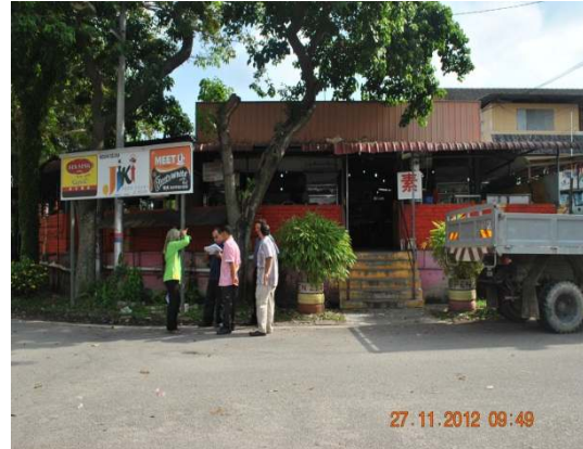
Gambar 1.10 Bangunan Perniagaan Di Atas Tanah Pertanian

Lokasi: Bukit Baru Seksyen II, Daerah Melaka Tengah Tarikh: 27 November 2012