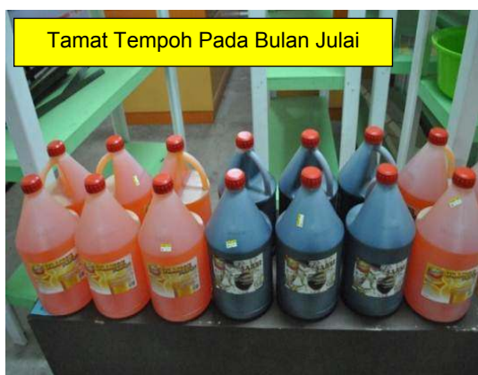
Gambar 2.7 Produk Makanan Tamat Tempoh

Lokasi: SDSI Negeri Kedah, MITC Melaka Tarikh: 27 Ogos 2012