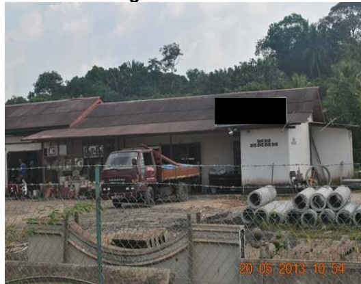
Gambar 1.8 Perniagaan Bahan Binaan

Lokasi: Pegoh, Daerah Alor Gajah Tarikh: 20 Mei 2013