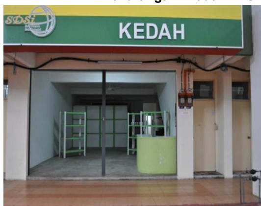
Gambar 2.3 Kekurangan Produk Di SDSI Negeri Kedah Dan Perak

Lokasi: SDSI Negeri Kedah dan Perak, MITC Melaka Tarikh: 27 Ogos 2012