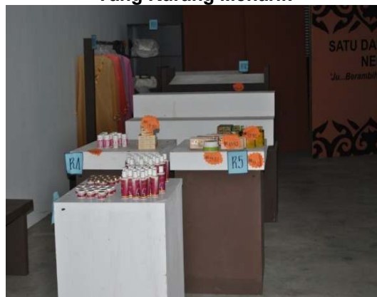
Gambar 2.2 Dekorasi Kedai SDSI Negeri Kelantan Yang Kurang Menarik

Lokasi: SDSI Negeri Kelantan, MITC Melaka Tarikh: 27 Ogos 2012