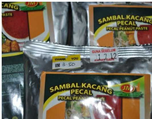
Gambar 2.5 Produk Makanan Tamat Tempoh

Lokasi: SDSI Negeri Kedah, MITC Melaka Tarikh: 27 Ogos 2012