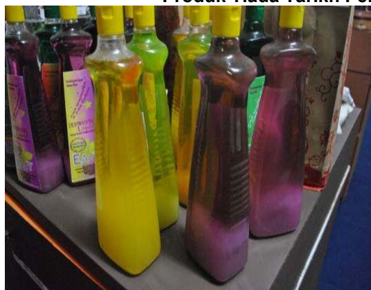
Gambar 2.9 Produk Tiada Tarikh Pengilangan Dan Tarikh Luput

Lokasi: SDSI Negeri Sabah, MITC Melaka Tarikh: 27 Ogos 2012