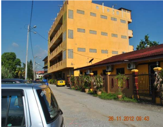
Gambar 1.9 Bangunan Perniagaan Di Atas Tanah Pertanian

Lokasi: Semabok, Daerah Melaka Tengah Tarikh: 26 November 2012