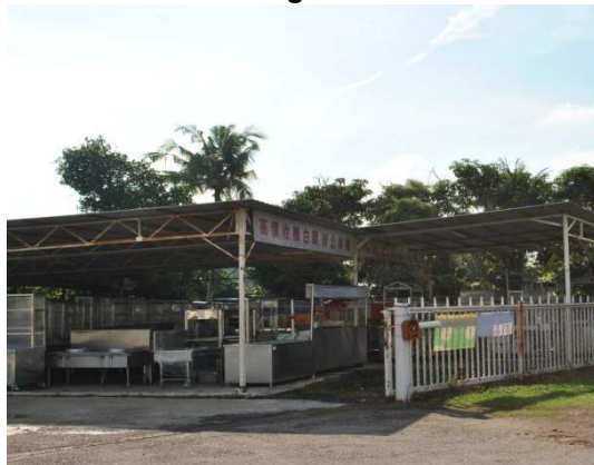
Gambar 1.3 Kedai Perniagaan Aluminium

Lokasi: Kawasan Bandar 36, Daerah Melaka Tengah Tarikh: 30 November 2012