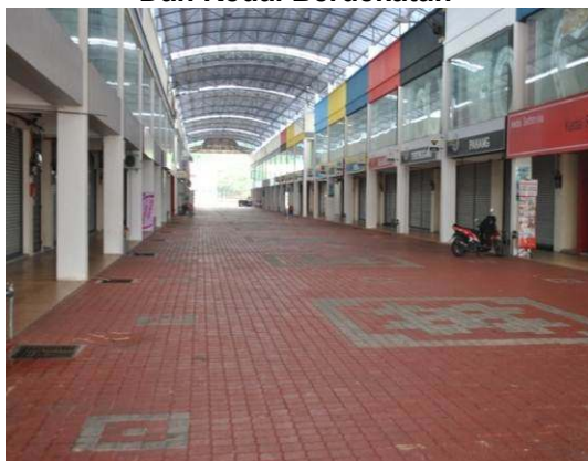
Gambar 2.1 Persekitaran Yang Sunyi Di SDSI Negeri Dan Kedai Berdekatan

Lokasi: SDSI Negeri-Negeri, MITC Melaka Tarikh: 27 Ogos 2012